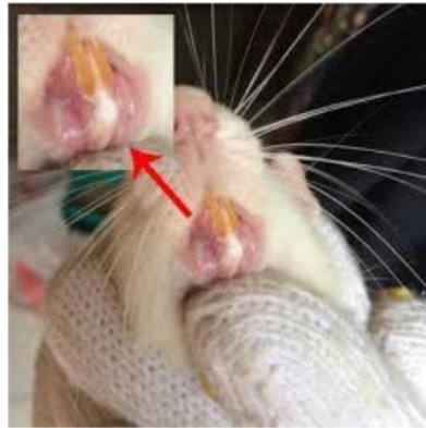
Gambar 1. Proses pembuatan ulkus pada hewan coba (Dokumen Pribadi).