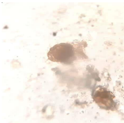
Gambar 3. Morfologi Telur Cacing Ascaris lumbricoides dengan Perbesar 400X

Berdasarkan hasil identifikasi siswa yang positif kecacingan, diketahui bahwa feces siswa yang positif mengandung cacing A. lumbricoides . Hal tersebut terlihat pada pengamatan mikroskopis dari feces siswa yang positif kecacingan yaitu ditemukannya telur cacing A. lumbricoides (Gambar 3). Hal tersebut didukung penelitian Prabandari et al. (2020) yang menyatakan bahwa feces siswa yang terjangkit kecacingan ditemukan cacing A. lumbricoides dengan jumlah siswa 24 siswa dari 74 siswa yang positif kecacingan. Selain itu, berdasarkan beberapa penelitian menunjukkan prevalensi ditemukan cacing jenis Askariasis lebih tinggi dibandingkan spesies lain (Amelia et al. , 2019; Charism 5 et al. , 2020; Rosmini, & Nurwidayati, 2017). Hal tersebut dikarenakan Cacing A. lumbricoides menginfeksi manusia melalui kontaminasi makanan atau minuman dengan telur fertil yang ada di tanah, sehingga dapat meningkatkan prevensi ditemukan jenis cacing ini pada feses manusia terutama anak-anak yang tingkat kesadaran kebersihannya rendah.