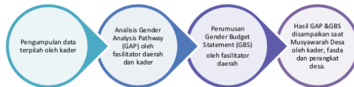
Gambar 1. Alur Pelaksanaan Pengabdian Masyarakat

Metode pengabdian yang dilakukan dalam kesempatan ini ialah metode pemberdayaan masyarakat. Pemberdayaan masyarakat yang dimaksud ialah dengan meningkatkan kapasitas masyarakat agar dapat mengumpulkan data masalah kesehatan dan sosial di desa secara mandiri (data tersebut disebut sebagai data terpilah) lalu mengolahnya menjadi informasi yang bisa digunakan untuk merancang sebuah program yang tepat. Data terpilah dikumpulkan oleh kader desa yang sekaligus ialah siswa Sapa MAMA Desa Margopatut berdasarkan wilayah dampungannya masing-masing. Data terpilah yang dikumpulkan merupakan data primer hasil SENSUS oleh para kader desa menggunakan lembar bantu berupa tabel observasi. Lembar observasi tersebut memuat data nama, usia dan alamat responden. Data terpilah berisi data lansia terantar, data pernikahan, anaka terlantar dan data masalah Kesehatan social lainnya berdasarkan jenis kelamin. Adapun alur kegiatan pengabdian masyarakat digambarkan dalam bagan berikut. Pengumpulan data terpilah di desa pilot project ini adalah sebuah kewajiban utama desa sebagai modal utama mewujudkan Desa Ramah Perempuan dan Peduli Anak (DRPPA).