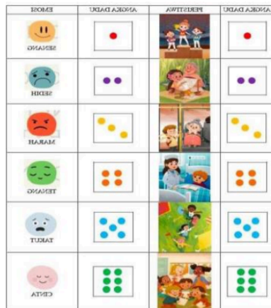
Gambar 1: lembar kerja dan permainan dadu bercerita

Materi yang diberikan pada psikoedukasi ini menggunakan permainan dan lembar kerja yang berjudul "Dadu Bercerita". Pemberian lembar kerja dan permainan ini bertujuan menambah pemahaman siswa tentang emosi dan apa yang harus dilakukan ketika merasakan emosi-emosi itu. Selain itu, dengan bantuan lembar kerja dan permainan akan memudahkan siswa memahami materi yang diajarkan karena siswa terlibat langsung dan merasakan bentuk-bentuk emosi yang diajarkan (Joyce&Weil, 2009)