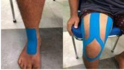
Gambar 1. Pemasangan Kinesiotaping

Tindakan fisioterapi peneliti melakukan evaluasi untuk melihat perbedaan hasil pemeriksaan awal dengan setelah diberikannya intervensi tersebut.