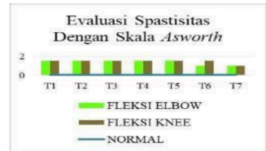
Diagram 2. Evaluasi Spastisitas