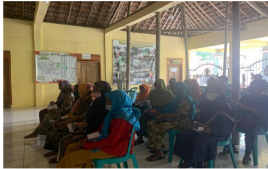
Gambar 4. Pelaksanaan Penyuluhan Kepada Masyarakat

Setelah kegiatan penyuluhan selesai dilaksanakan, peserta yang hadir diberikan posttest sebagai evaluasi pemahaman masyarakat tentang materi yang disampaikan. Dari hasil pretes dan postes, dilakukan penilaian dan analisis, sehingga diperoleh kesimpulan bahwa peserta kegiatan mengalami peningkatan pemahaman tentang materi yang disampaikan sebesar 95,12% seperti yang tampak pada Gambar 5.