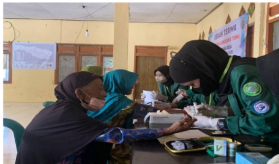
Gambar 3. Pemeriksaan Gula Darah

Setelah kegiatan pengecekan Kesehatan selesai dilaksanakan, dilanjutkan dengan pemberian penyuluhan kepada masyarakat yang hadir tentang makanan yang sehat untuk mengantisipasi tingkat keparahan Covid-19 dengan komorbid DM dan dilanjutkan sesi tanya jawab dan diskusi.