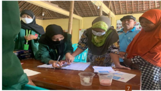
Gambar 1. Absensi dan Pendataan Peserta Penyuluhan