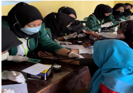
Gambar 2. Pemeriksaan Tekanan Darah