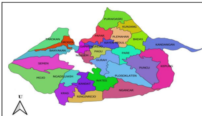
Gambar 1. Peta wilayah Kabupaten Kediri berdasarkan kecamatan

Angka Kematian Bayi dengan usia kurang dari 1 tahun. Angka kematian tertinggi terjadi pada tahun 2017 dan 2018 dengan frekuensi masing-masing sebanyak 13 kematian.